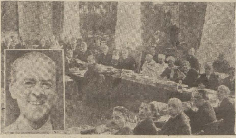
Hind meselesini ilkönce görüşen Londrada toplanan yuvarlak masa konferansı, köşede Sir Cripps